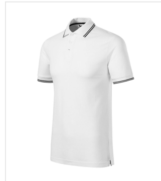
232 Polo Shirt men's Focus