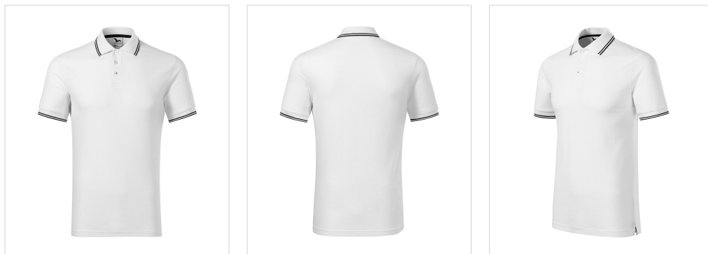
232 Polo Shirt men's Focus shown