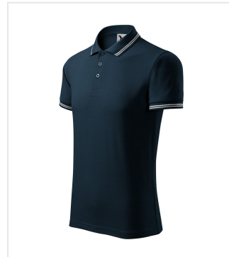
219 Polo Shirt men's Urban