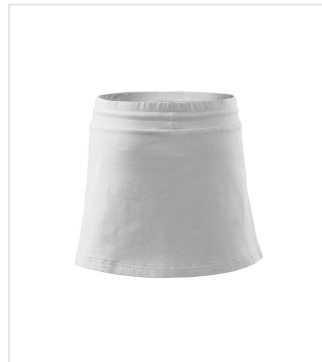
604 Skirt women's Two in one