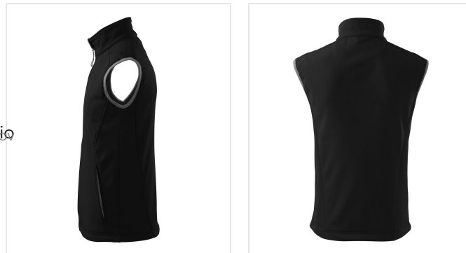
517 Softshell Vest men's Vision